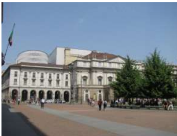
opera La Scala