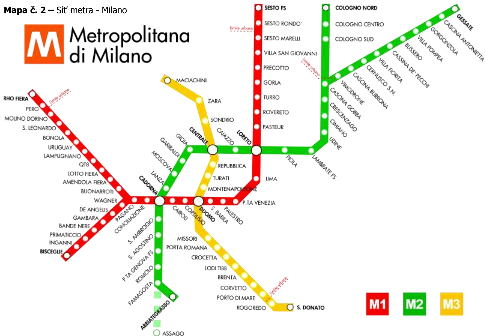
Mapa č. 2 – Síť metra - Milano

Cena: 1,5 euro – jednorázová; 4,5 euro – celodenní