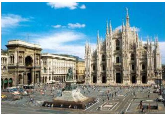
Katedrála Duomo, vlevo vstup do Galerie